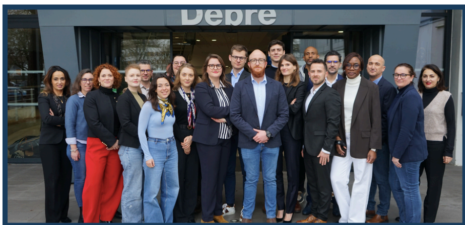
EHESP Conseil 2026